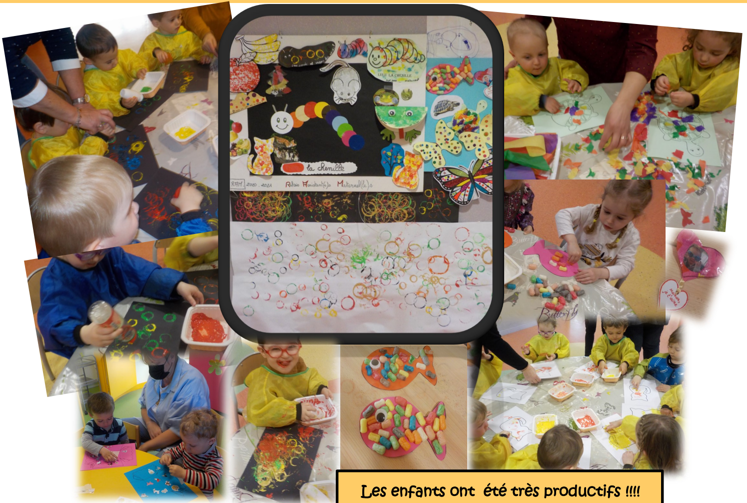
Les enfants ont été très productifs !!!!