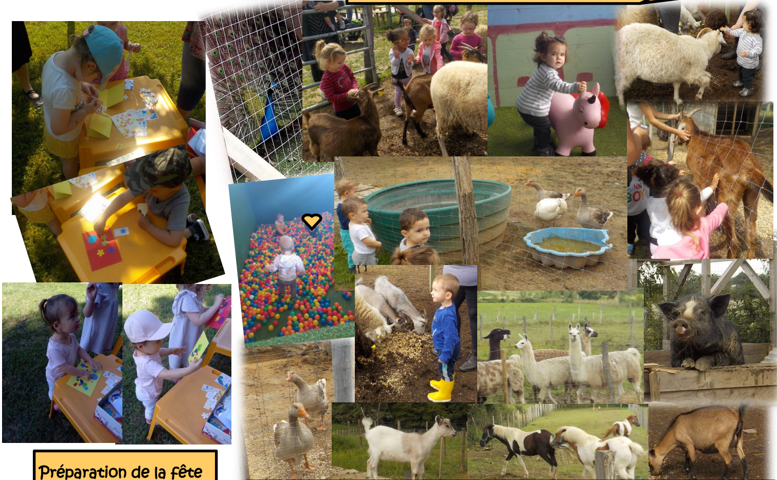
Préparation de la fête des papas en plein air